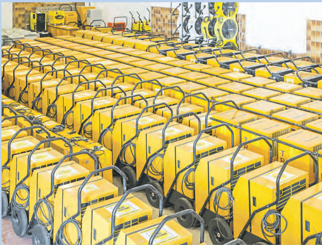
Die Firma Liesner verfügt über einen modernen Maschinenpark.

Heiden (pd/hie). Aufgrund des großen aktuellen Maschinenparks ist das Bautrocknungsunternehmen Liesner in der Lage, kurzfristig Hilfe zu leisten. Geräte zur Entfeuchtung, Baubeheizung, Ventilation und Geruchs-beseitigung werden vielfach von Bauherren gemietet, um den Baufortschritt positiv zu beeinflussen. Schließlich sollen zum Beispiel Putz und Estrich schnell aber behutsam austrocknen. Außerdem bietet die Firma Ralf Liesner Bautrocknung auch die erforderliche Messtechnik zur Ortung von Lecks und Feuchtigkeitsuntersuchungen an. Ein weiteres Beispiel für das fachliche Know-how der Mitarbeiter und des Unternehmens ist die optische Wiederherstellung keramischer Bodenbeläge nach Wasserschäden. Nach einem Wasserschaden oder Rohrbruch muss der Estrich unter keramischen Oberböden getrocknet werden. Zur Vorbereitung dieser Trocknungsmaßnahmen wurden früher Fliesen zerstört bzw. entfernt und mussten anschließend ersetzt werden. Waren die