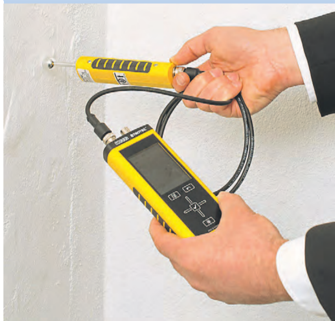
Feuchtigkeit in Wänden kann gemessen werden.