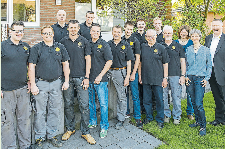
Das Team von Liesner Bautrocknung aus Heiden kümmert sich seit 20 Jahren um Wasserschäden und Co.

Mit speziellem Equipment und dem nötigen